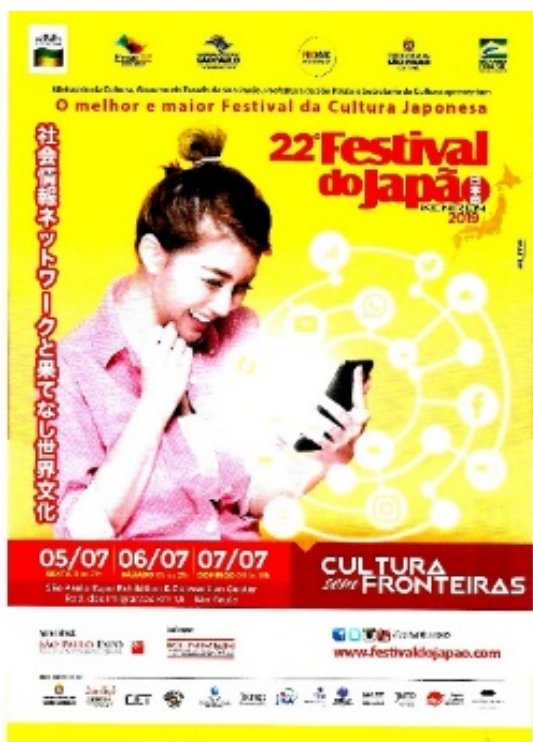
IMAGEM DA KENREN

Estudantes e homens entre 60 a 64 anos pagarão meia entrada.