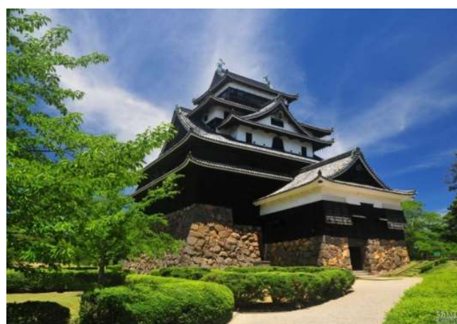
CASTELO DE MATSUE - SHIMANE